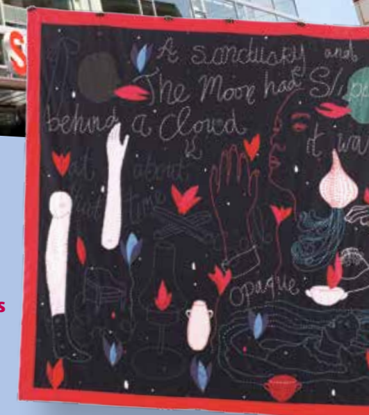
Keetje Mans, In Midwig 2016, textiel 150 x 164 cm

Bel 043 - 369 06 10 of mail naar service@envida.nl