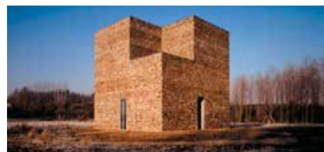
Dagtrip Museum Insel Hombroich en het Rheinische bruinkoolgebied